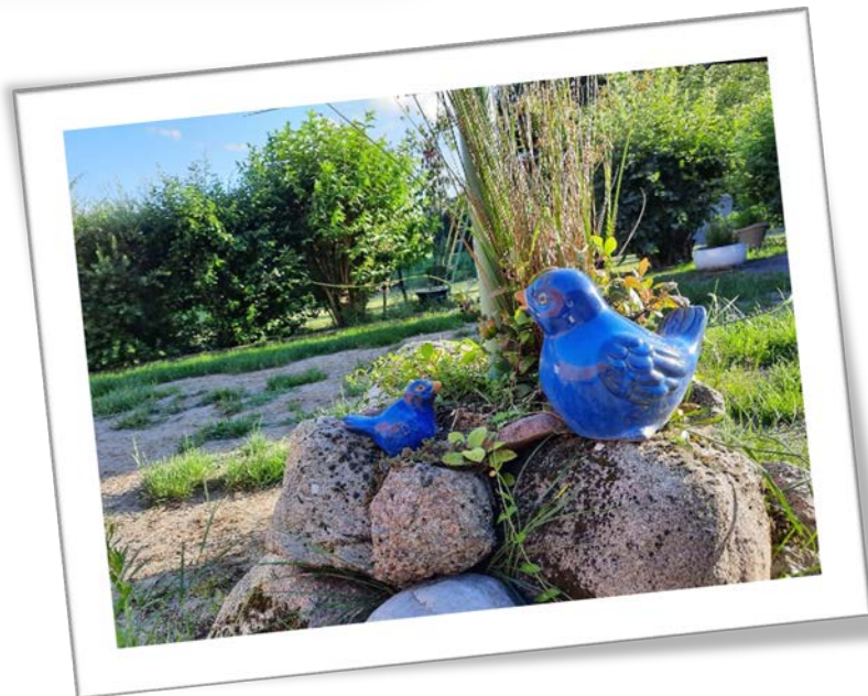
Ich und Glissi. 5 Juli 2020

Am Samstag bin ich dann also in unsere Landeshauptstadt Hannover geflogen. Das hat ein bisschen gedauert und geregnet hat es auch, aber als ich ankam landete ich auf eine Statue um meine Federn zu trocken.